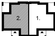
ORIENTACJA BUDYNKU MIESZKALNEGO W ZABUDOWIE BLIŹNIACZEJ WERSJA A